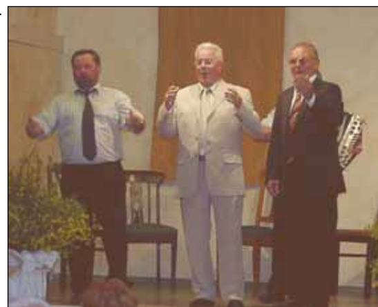
Die Bürgermeister als „3 junge Tenöre“