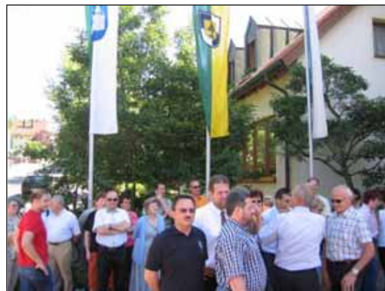
Vor dem Burgthanner Rathaus