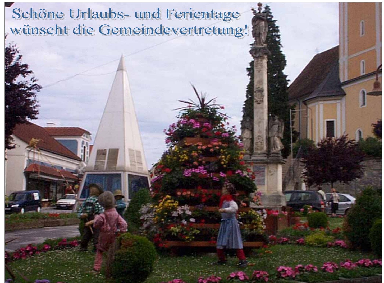
Neue Blumenpyramide am Hauptplatz