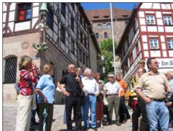
Besichtigung Nürnbergs Altstadt

Seit 10 Jahren besteht die Partnerschaft mit der deutschen Großgemeinde Burgthann. Und dies wurde von 3. bis 5. Juni auch ausgiebig gefeiert und zwar diesmal in Burgthann, wo die St. Ruprechter Delegation herzlich empfangen und bewirtet wurde. Jeder der 30 Ruprechter Teilnehmer spürte, dass diese Partnerschaft auch von allen dortigen Vereinen geschätzt und aktiv mitgetragen wird, waren doch am Freitag zum gemeinsamen Abendessen mit anschließendem gemütlichen Beisammensein im Sport-