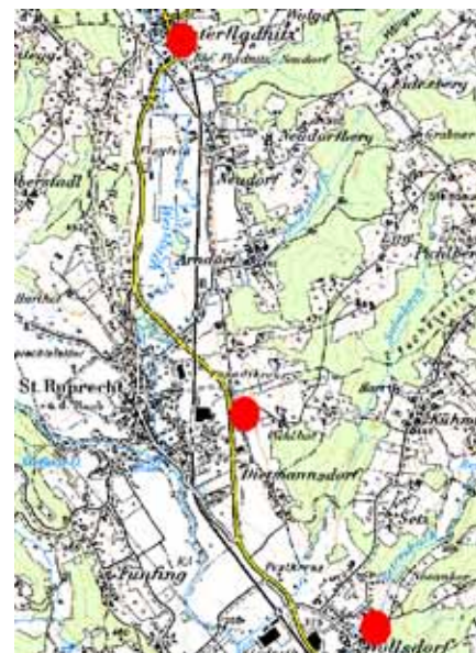
Die 3 untersuchten Standortvarianten

Die Kosten für das Bauvorhaben werden inkl. Aufschließung, Einrichtung, techn. Anlagen, Außenanlagen, Planungs-, Bauaufsicht und Architektenhonoraren sowie diversen Nebenkosten und einer Reserve auf ca. 1,16 Mio. Euro ge-