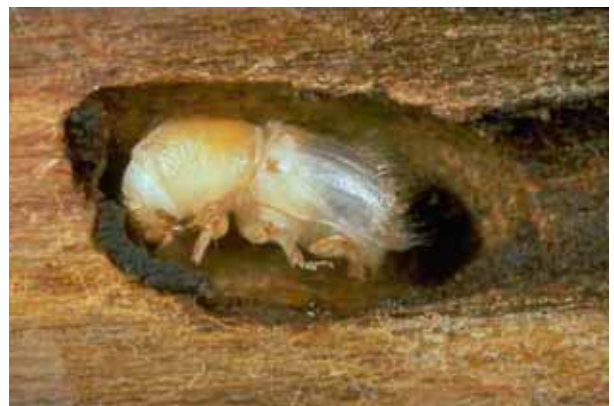
Klein, aber gefährlich - Der Borkenkäfer

Alle Waldbesitzer werden daher aufgefordert Ihre Waldbestände umgehend zu kontrollieren und ev. notwendige Schlägerungen durchzuführen oder durchführen zu lassen.