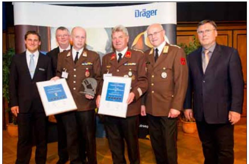
www.ff-kuehwiesen.at ist die beste Feuerwehr-Website der Steiermark!

Die Feuerwehr Kühwiesen konnte mit ihrem Internetauftritt die Fachjury überzeugen, wurde in der Bundeswertung mit dem 7. Platz ausgezeichnet und weiters zur besten Website der Steiermark gekürt.